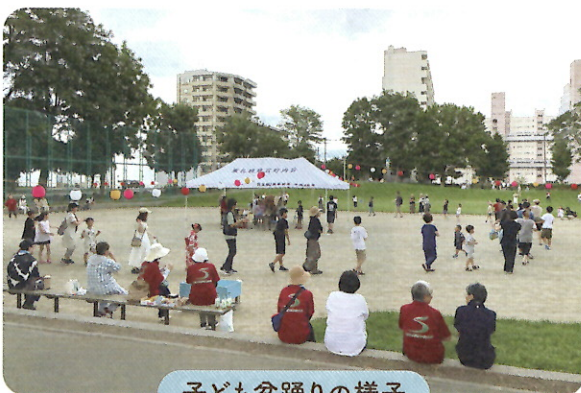
子ども盆踊りの様子

また、行事は見守り活動にもつながるため、近年独居高齢者が増えていることから、誰でも気軽に参加できるような行事にしていきたいです。