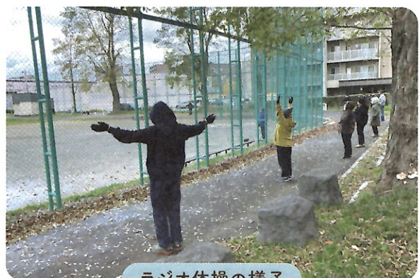
ラジオ体操の様子