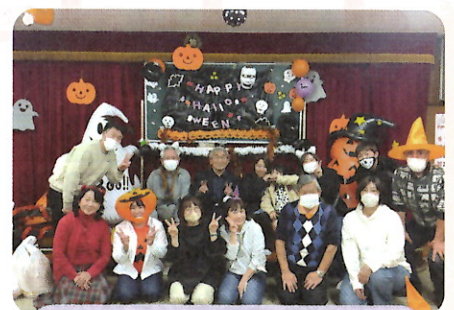
令和6年10月 ハロウィンわくわくランドの様子