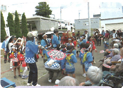
令和6年9月 子供樽神輿町内渡御の様子

月寒川の改修工事あと2年程で終わるため、川辺やかしま山公園の活用方法についても検討していきたいです。