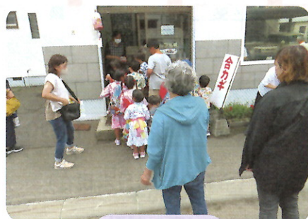
令和6年7月 七夕の様子